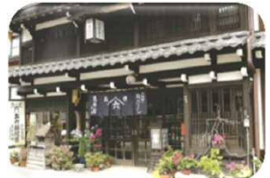
藪原宿(篠原商店)正面

村の中心である藪原地区は、江戸時代には中山道六十九宿の一つ「藪原宿」として栄え、伝統工芸品「お六櫛」の産地で有名です。また「平成の名水百選 水木沢天然林」「ため池百選 あやめ公園池」「こだまの森」など、豊かな自然を季節ごとに楽しめます♪気候や地形を生かした特産の高原野菜もおいしくておススメです☆