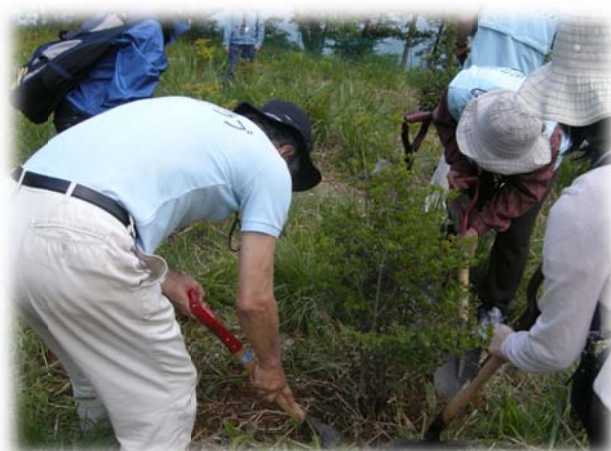
🍃 植樹の様子 🍃