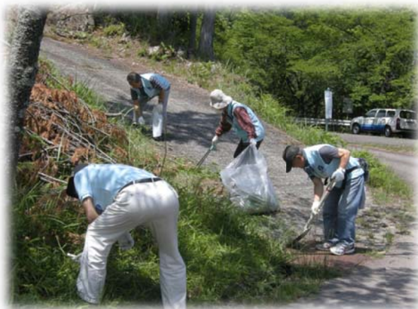
🍃 清掃活動の様子 🍃

保全活動の内容は、岩屋ダムを見下ろす場所に建立された卯野原神社付近の清掃とドウダンツツジ、アセビ等の植樹です。活動は、下流地域の私たちだけではなく、上流地域の下呂市役所の方も参加され、双方で水源地を守っていこうという意識や熱意を感じました。