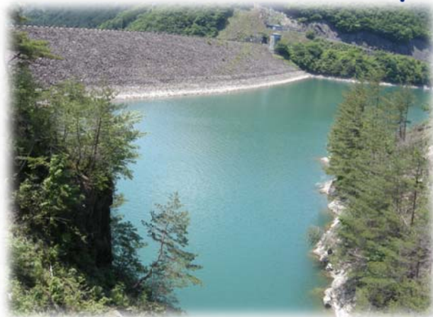
🍃 岩屋ダム（岐阜県下呂市） 🍃