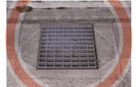
雨水が入りやすい!