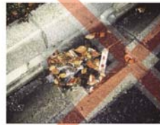
雨水が入りにくい