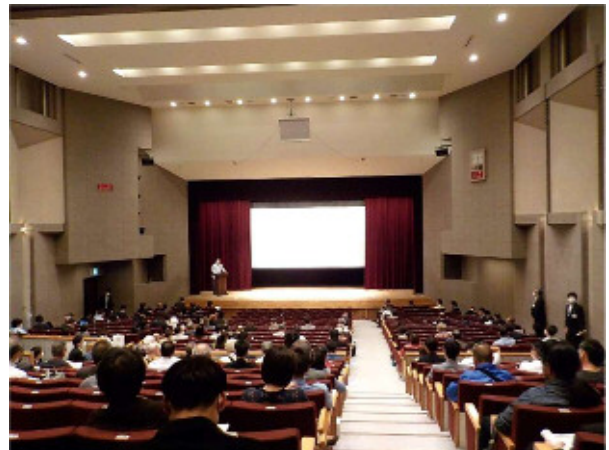
一般参加者からの意見聴取