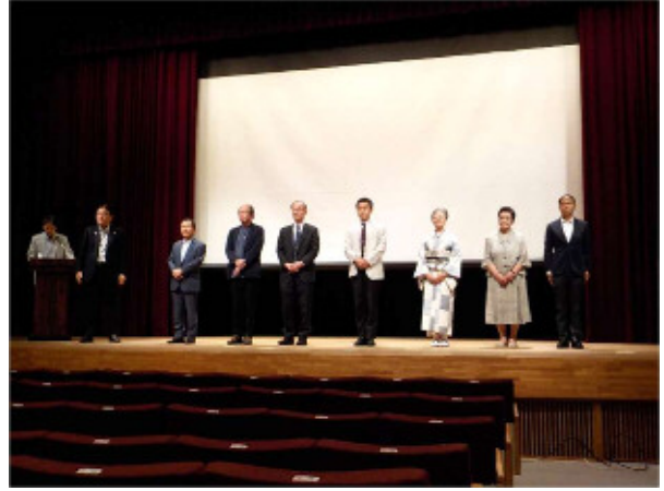
学識者等の意見発表者紹介