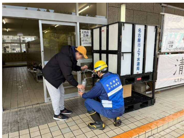
応急給水活動（珠洲市）