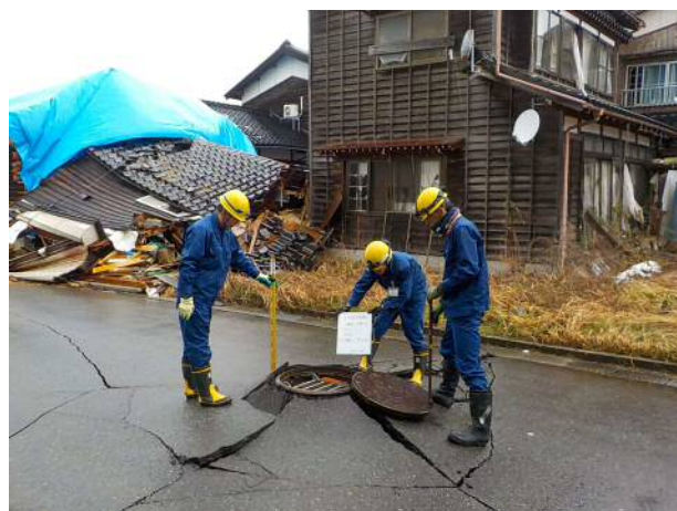
下水管きよの被害調査（珠洲市）