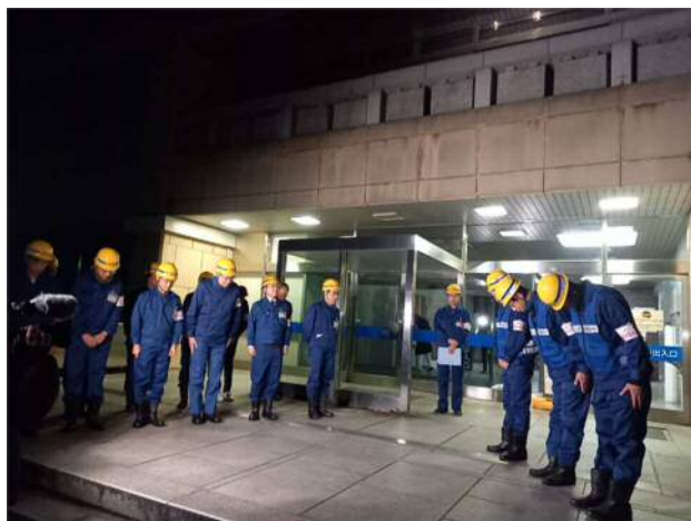
発災当日の先遣調査隊出発式