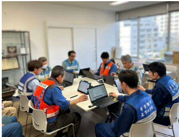
日本水道協会と応援都市との打ち合わせ（金沢市）