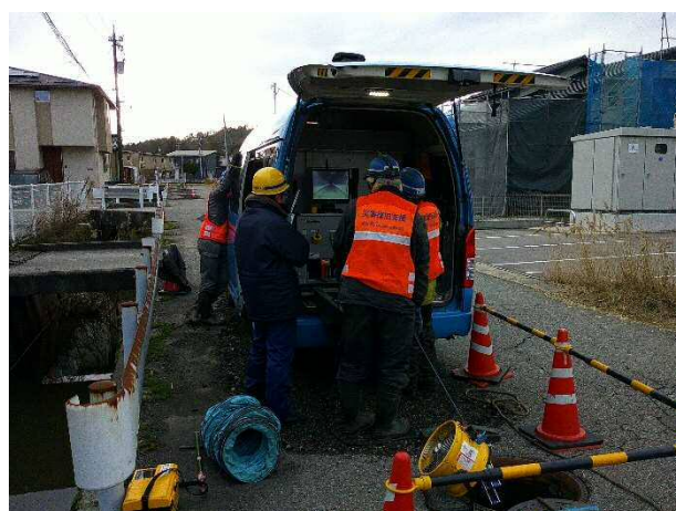
下水管のテレビカメラ調査（七尾市）