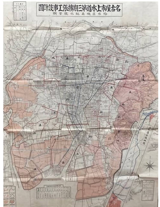
名古屋市上水道第三期拡張工事設計図

水の歴史資料館で保存している資料等を紐解き、「断水のないなごやの水道」として、暮らしを支えてきた歴史をパネルや資料等で振り返り、現存している100年以上前の貴重な文書や資料を展示します。