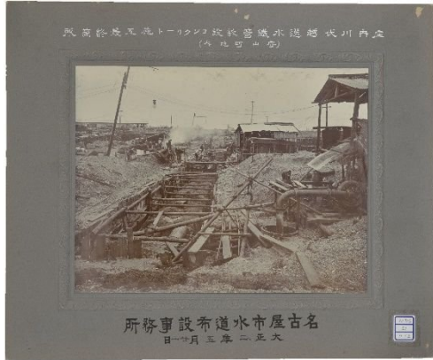
水道創設工事（庄内川伏越工事） 水道布設事務所撮影（大正2年）

なごやの水道は、大正3（1914）年9月に給水を開始して以来、市民の生活や産業を支え、「断水のないなごやの水道」の歴史を築いています。これも水量豊富で清浄な木曾川に水源を求めたことが大きく、また、その後も先人の努力により幾度の試練を乗り越えてきました。今回、「水の歴史資料館」が開館10周年を迎えるにあたり、資料館で保存している資料等を紐解き、「断水のないなごやの水道」として、くらしを支えてきた歴史をその時代背景を含め振り返りました。現存している100年以上前の貴重な写真や資料等も展示しています。是非、この機会に、110周年を迎える「なごやの水道」の歴史に触れてみてください。